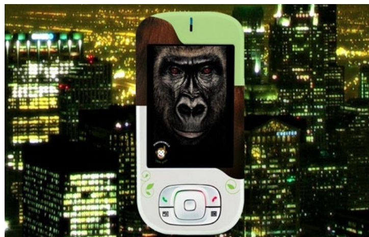
“Simiomobile”, la primera versión de la gama “Digital Jungle Mobile” dedicada a la preservación de los grandes simios.

Conscientes de que no hay marcha atrás posible para el desarrollo tecnológico, pensamos en proyectos que equilibren intereses y garanticen la protección de los sectores más frágiles y desprotegidos, intentando hacer rentable una postura ecologista. No queremos pensar que las generaciones más jóvenes asisten indiferentes a la desaparición de especies naturales. Creemos que el mundo natural no forma parte -en la medida en que debiera- del ideal estético construido por los medios de comunicación. Por eso es fundamental labrar en el avance tecnológico el respeto por la biosfera; comprender el valor de lo natural y entender, que la dicotomía naturaleza/humanidad es una estructura artificiosa sobre la que se sostiene una dominación y explotación contraproducentes.